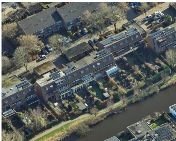
Afbeeld 2: bovenaanzicht

afbeelding 1: kadastraal overzicht met in blauw aangegeven, welk perceel de bewoner wil kopen